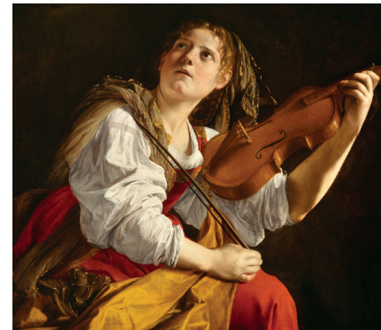
Young Woman with a Violin“ von Gentileschi, 1612